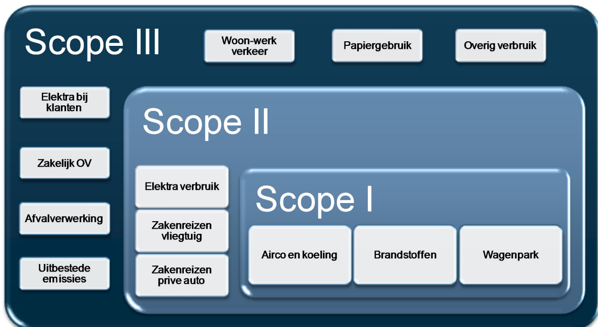
Figuur 1 Scopes Carbon Footprint-analyse

De CO 2 -emissie is geanalyseerd in overeenstemming met de CO 2 -prestatieladder, handboek versie 3.0.